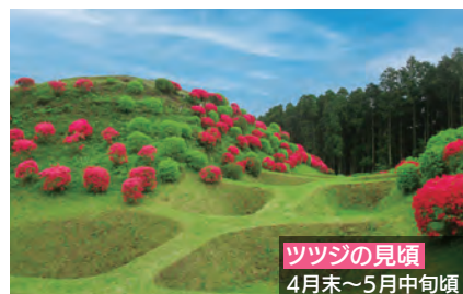
ツツジの見頃 4月末～5月中旬頃