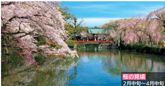
桜の見頃 2月中旬～4月中旬